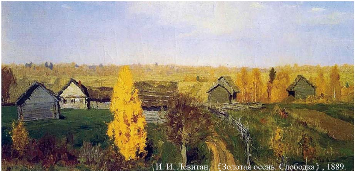
И. И. Левитан. «Золотая осень. Слободка», 1889.

Graduate Institute of Russian Studies College of International Affairs