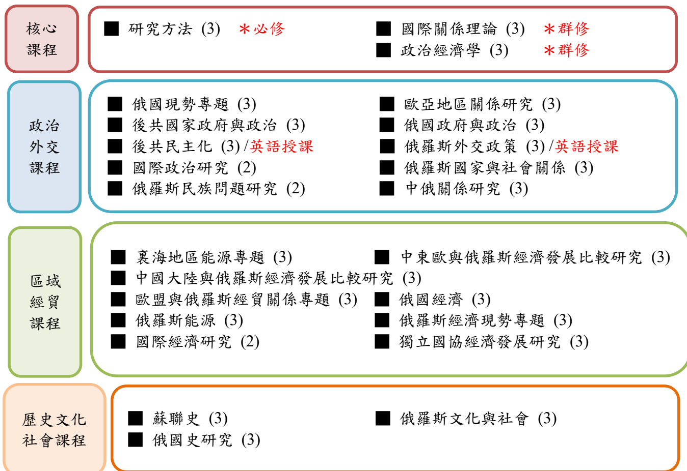
圖 2-1 俄羅斯研究所課程學習地圖

俄羅斯研究所四大課程學習領域如下圖所示。核心課程包括全院共同必修課程「研究方法」以及兩門群修課程「國際關係理論」和「政治經濟學」。另外學生得以依照專業領域學習，選修政治外交、區域經貿與歷史文化社會等三大區域研究領域課程。