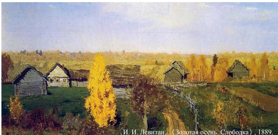
И. И. Левитан, «Золотая осень. Слободка», 1889.

Graduate Institute of Russian Studies College of International Affairs